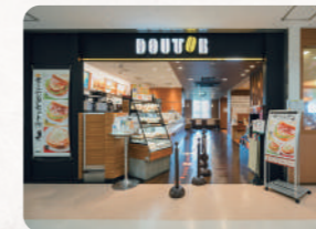
ドトールコーヒー