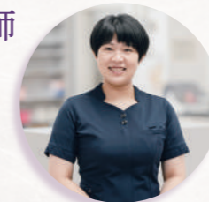
認知症看護認定看護師（2008年入職）

認知症をもつ患者さんや認知機能が低下した患者さんに対して、認知症サポートチームの一員として病棟を横断してケアを行っています。認知機能のアセスメントや課題に対応しながら、患者さんの治療や検査の不安を最小限にするケアを行います。認定資格を取ったことで、知識はもちろん新しい仲間が増え、看護の面白さを実感できるようになりました。