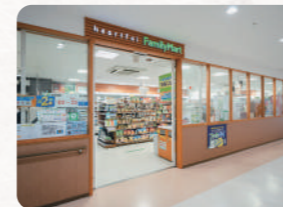
コンビニ (Family Mart)

院内にはレストラン、コンビニ (Family Mart)、ドトールコーヒー、銀行ATM、仮眠室などの便利施設が充実しています。