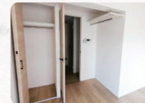
※ 画像はあくまで参考です。実際に入舎する部屋とは異なります。

病院近辺にワンルームタイプの民間マンションを職員宿舎として一部借り上げます (入舎期限: 看護師免許取得後3年目まで)。