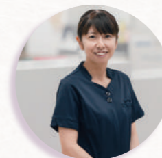
小児看護専門看護師（2002年入職）

働きながら長期履修制度を利用して大学院に通い、専門資格を取得しました。現在は子どもたちの療養生活を支援し、他の医療スタッフと連携して質の高い看護の提供を目指しています。また、看護師から相談があったときは、専門看護師として一緒に考えて、スタッフ一人ひとりが自信を持ってケアが実践できるようサポートしています。