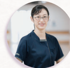
緩和ケア認定看護師（2020年入職）

認定資格を2006年に習得し、臨床や教育など様々な経験をしてきました。現在、緩和ケアチーム専従看護師として多職種と連携し、がん患者さんの身体的苦痛や気持ちのつらさなどを和らげるケアを行っています。患者さんの価値観を尊重して話を聴き、そばで寄り添うケアを実施し、スタッフへ繋ぎよりよい看護を目指します。