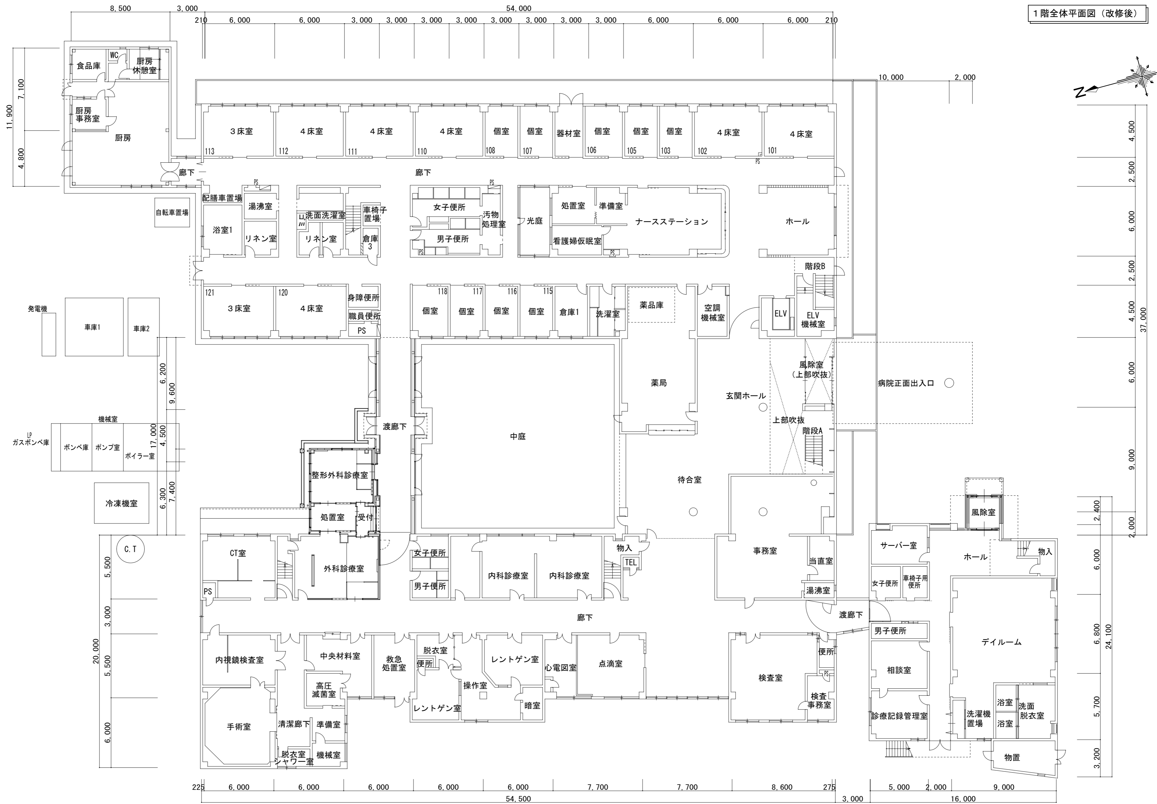
1階全体平面図 (改修後)