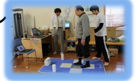
転倒危険度テスト